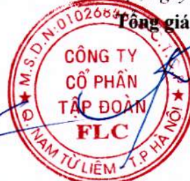
HƯƠNG TRẦN KIỀU DUNG